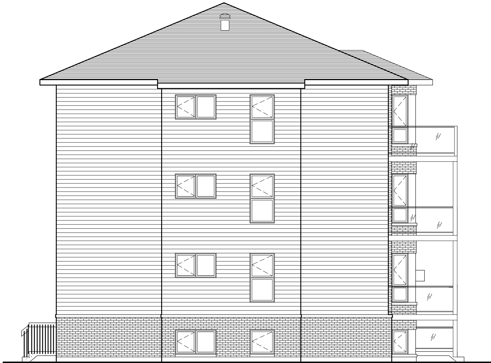
Latérale gauche & droite